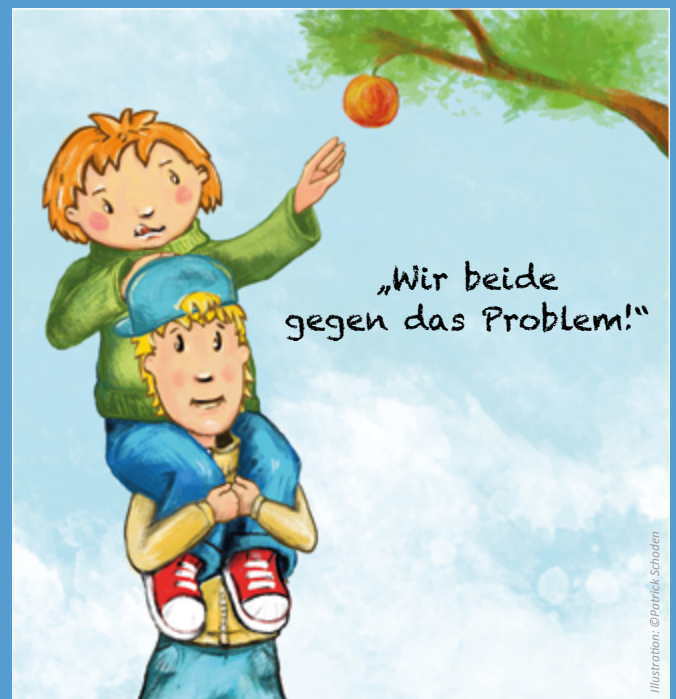
Illustration: ©Patrick Schoden

Aber echtes Zuhören bedeutet, wirklich verstehen zu wollen, wieso jemand so und nicht anders reagiert. Stellen wir uns vor, Jakob würde ihn fragen: „Papa, warum findest du das denn so blöd, wenn ich das Handy länger in der Hand halte?“ Zugegeben: das klingt erst mal etwas seltsam und unrealistisch 😊. Doch dann könnte sein Vater erklären, dass es ihm gar nicht um die Minuten geht, die Jakob länger am Handy ist. Er hat in letzter Zeit einfach häufig das Gefühl, dass das, was er mit Jakob bespricht, keine Bedeutung mehr für ihn hat. Dass es ihm egal ist. Und das stört ihn.